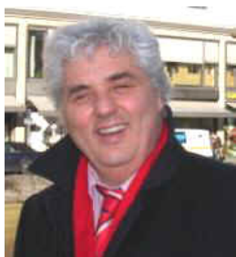
Presidente Comm. Carmine Macaluso