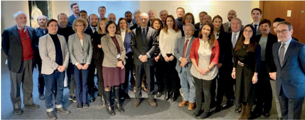
Una foto ricordo del gruppo che ha partecipato ai lavori per la promozione del "Sistema Italia" in Ambasciata.

Il 1 dicembre si sono svolti incontri con la partecipazione dei Capi degli Uffici consolari, dei Direttori degli Istituti Italiani di Cultura, dei Dirigenti scolastici, degli Esperti della Sede, del Direttore di ICE Berlino, dei Segretari Generali delle Camere di Commercio italiane e della Direttrice ENIT per fare il punto sulle iniziative di promozione della rete in Germania in tutti i settori di attività. In serata, l'Ambasciatore Varricchio ha ospitato un ricevimento alla presenza di esponenti della collettività