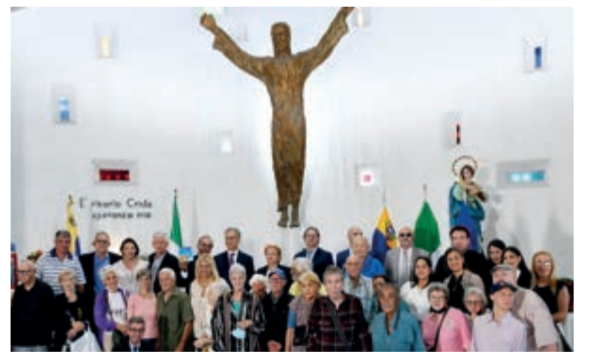
Un gruppo di partecipanti alla Festa di Natale posa nella Chiesa "Nuestra Señora de Pompei" in una foto ricordo. Il progetto della Chiesa "Nuestra Señora de Pompei" fu guidato dall'Ingegnere Giorgio Bruttini.